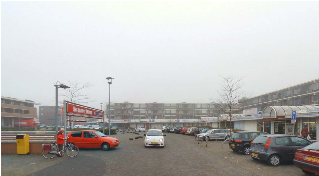
Winkelcentrum Kort Ambacht