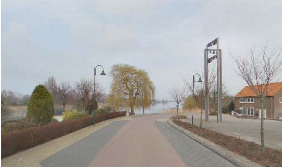
Het uitzicht vanaf de locatie van het oude gemeentehuis Heerjansdam

De locatie heeft een prachtige ligging aan de oude rivier de Waal met een uitzicht op het buitengebied. Gezien deze ligging kan horeca als ondersteuning van de dagrecreatie deel uitmaken van een eventueel herstructureringsplan.