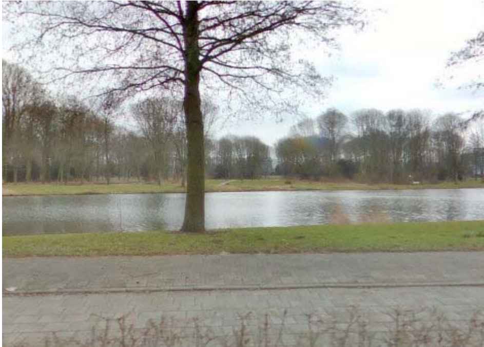
De oever van de singel aan het Develpark.

Langs de oever van de Develsingel is ter ondersteuning van de dagrecreatie ook horeca in de vorm van een pannenkoekenrestaurant denkbaar.