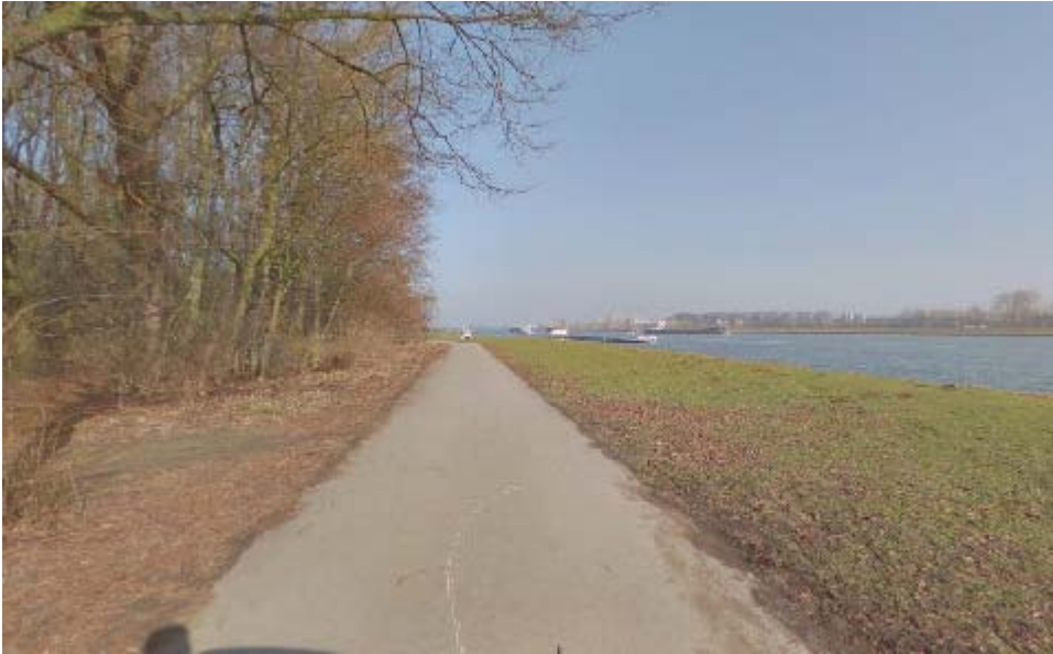
Het Noordpark met uitzicht op de rivier