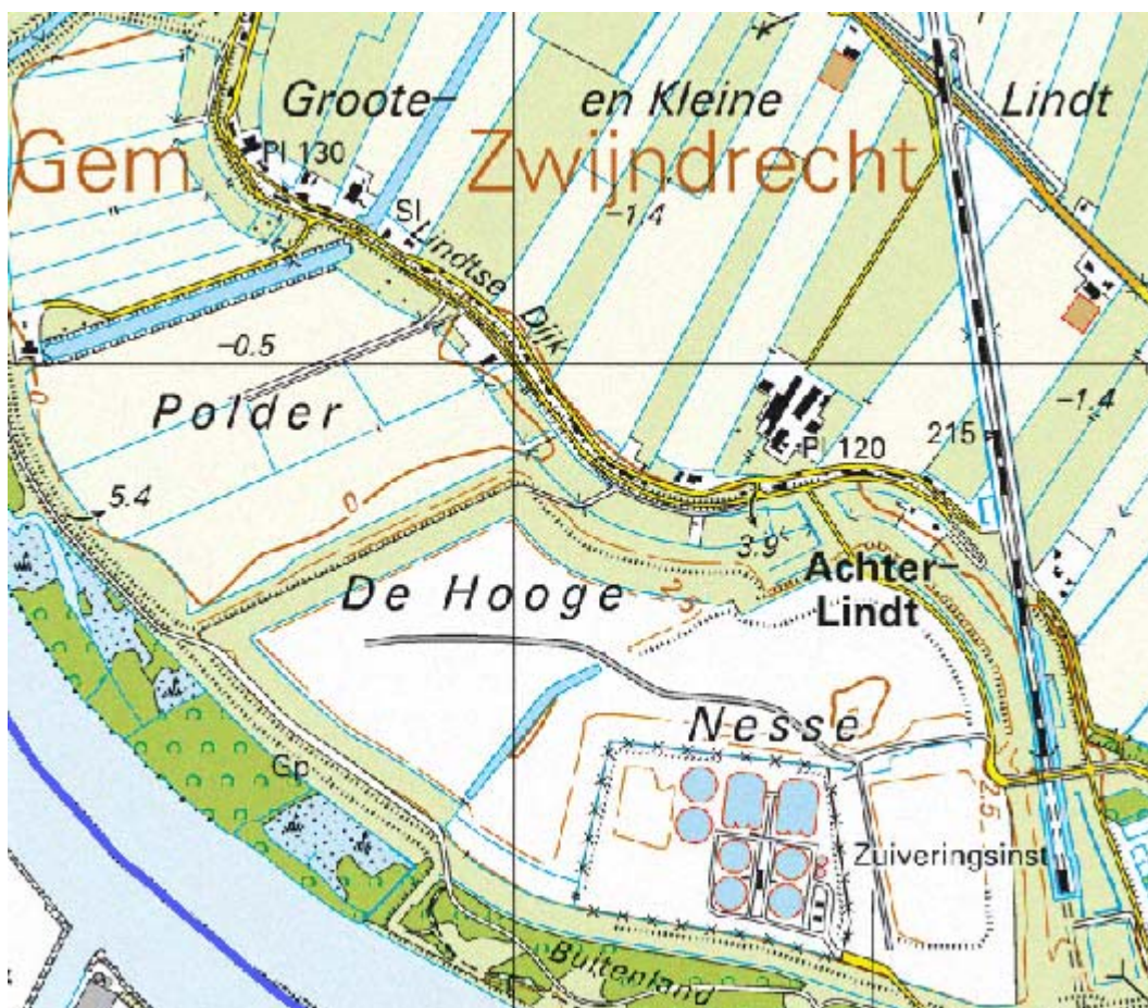
Polder de Hooge Nesse

Er worden tevens plannen ontwikkeld om ook de polder Hoge Nesse te herontwikkelen tot verblijfs- en recreatiegebied. Voor deze dagrecreatie is horeca in de vorm van café – restaurant een goede aanvulling.