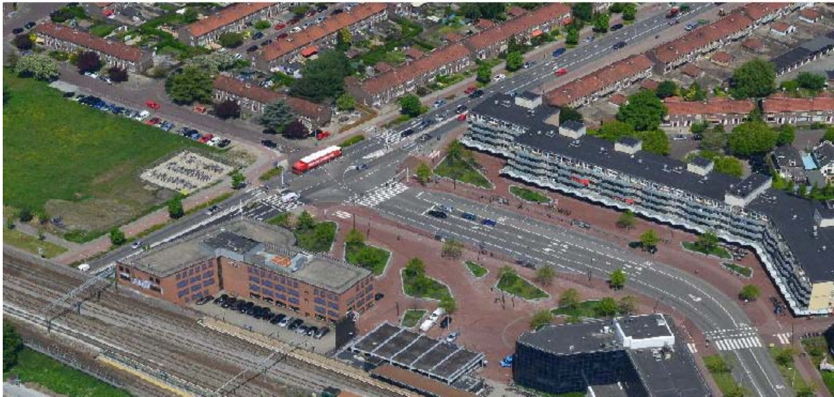
(Fig. 3) stationsgebied