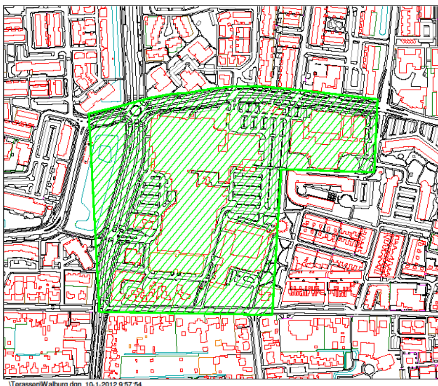
(fig. 2) Horeca concentratiegebied Stadshart Walburg