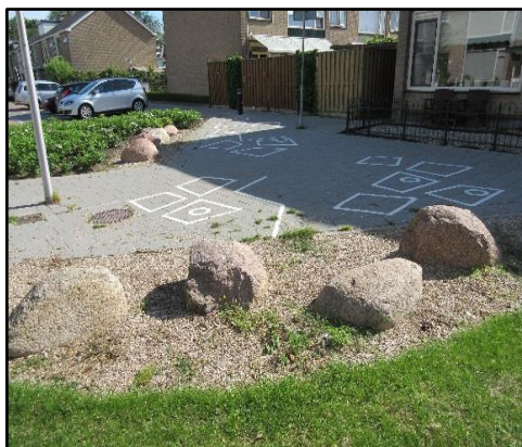
Afbeelding 5.4: informele speelruimte, grasveld de Groene Zoom (Heerjansdam) & pleintje Vogelbuurt