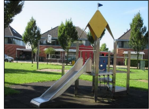
Afbeelding 5.3: voorbeelden formele speelruimte

Om de kwaliteit en het aanbod van de huidige en toekomstige formele speelruimte te kunnen toetsen, hanteren we de richtlijnen uit afbeelding 5.7. De demografische gegevens en het aanbod aan informele speelruimte is bepalend voor de noodzaak van een formele speelplaats.