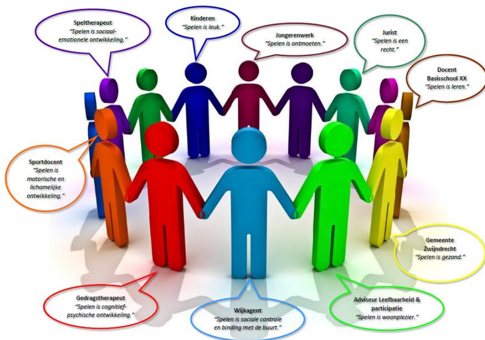
Afbeelding 5.1: samenwerking belanghebbenden

Het belang van spelen is groot en kan bovendien een bijdrage leveren aan de leefbaarheid en betrokkenheid in de wijk of eigen buurt. De eerste ambitie vertaald zich dan ook in 'samenwerking met andere belanghebbenden zoals: scholen, kinderdagverblijven, buurthuizen, wijkagenten, sportverenigingen en jongerenwerk' . Door een goede samenwerking met alle belanghebbenden kan een speelruimte meer zijn dan een ruimte met daarin een aantal speelvoorzieningen. De samenwerking zorgt ervoor dat een speelruimte een ontmoetingsplek is voor iedereen en een plek van iedereen.