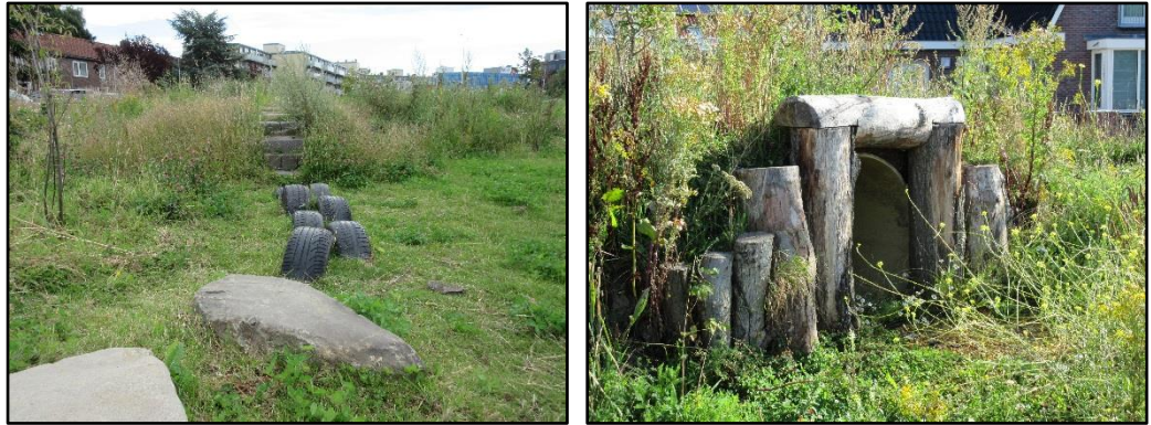
Afbeelding 5.5: natuurlijke speelruimte, van Yperenterrein

De kwaliteit van speelplekken wordt vergroot als de plekken zoveel mogelijk aansluiten op de groene waarden in de omgeving (bij het water of bij het omringende groen). Bij een herinrichting kunnen speelplekken, indien gepast, worden omgevormd naar een groene speelplek. Uitgangspunt is dat een plek meer natuurlijk wordt ingericht als bewoners hierom vragen.